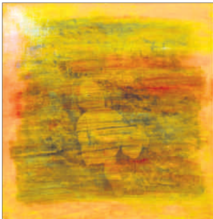
Det glømte barnet: Fotoemulsjon og olje. En teknikk Erstad etter hvert fant noe tidkrevende.