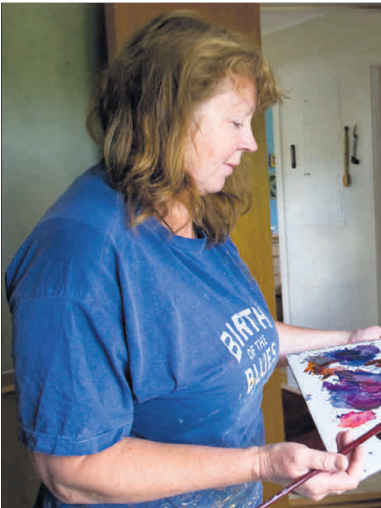
Blå time: Ferdigstillelse av oljemaleriet «Kveldslys», som pryder plakaten.